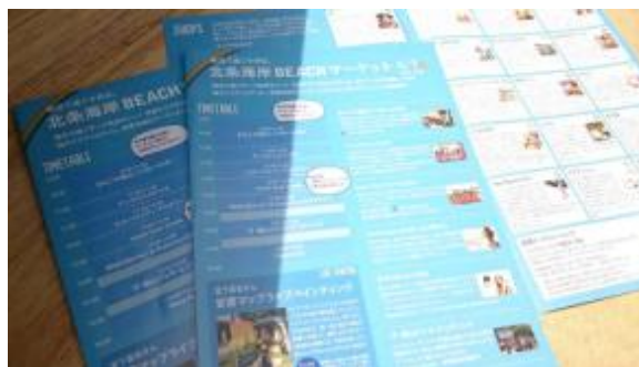
当日パンフレットの例

SNS（公式 Facebook ページ、Instagram）への掲載情報として、下記の資料提出をお願いいたします。申込フォームからご提出ください。